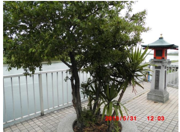
六郷橋のたもとの長十郎ナシの碑とナシの木がありました。 多摩川を汽車で渡ればなしの花…正岡子規