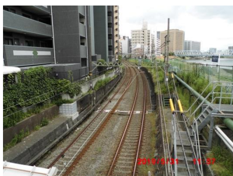
六郷大橋の下を京急大師線が通る。