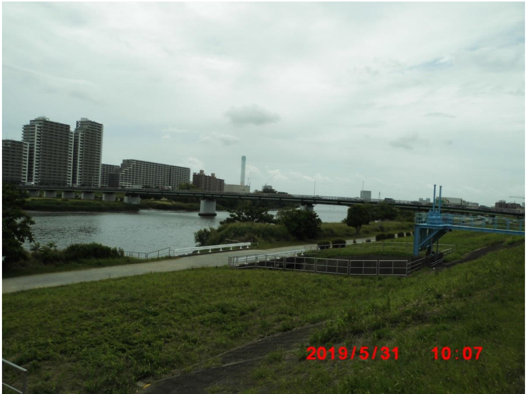
ガス橋を見る。左手が東京側。