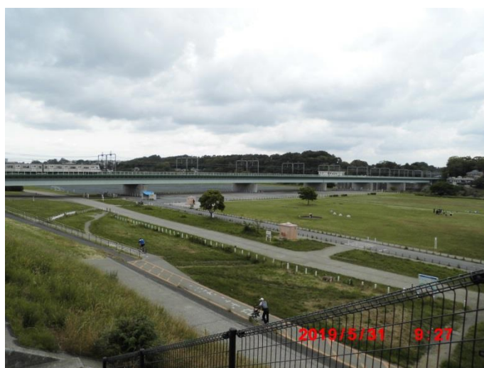
丸子橋から上流側を望む