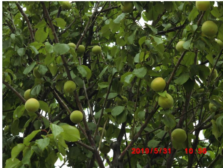
沢山の実がなっていました。