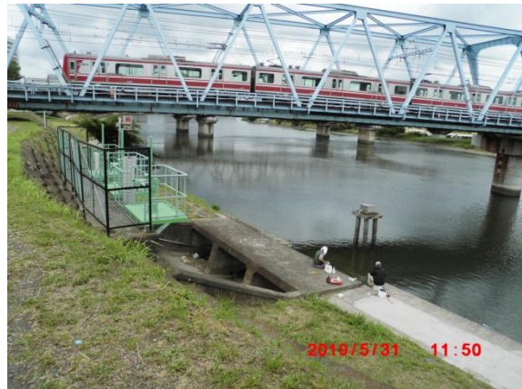
下流側から京急本線の橋を見る。