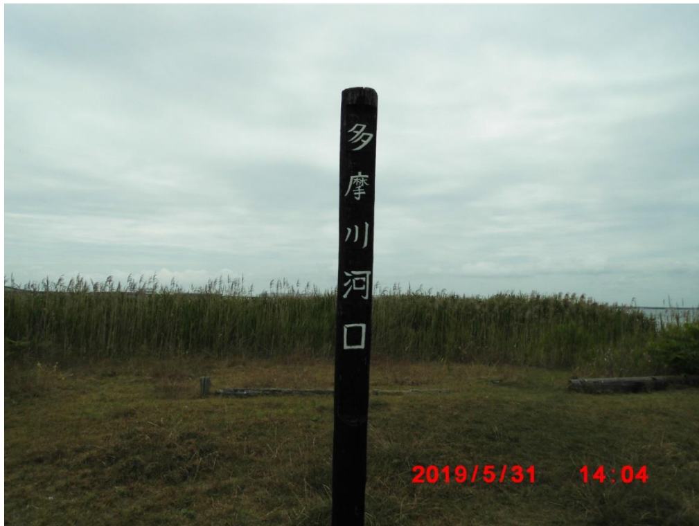
多摩川河口に到着。ゴール 14 時 4 分。丸子橋を 9 時 27 分スタート。 歩行時間 4 時間 37 分の行程でした。