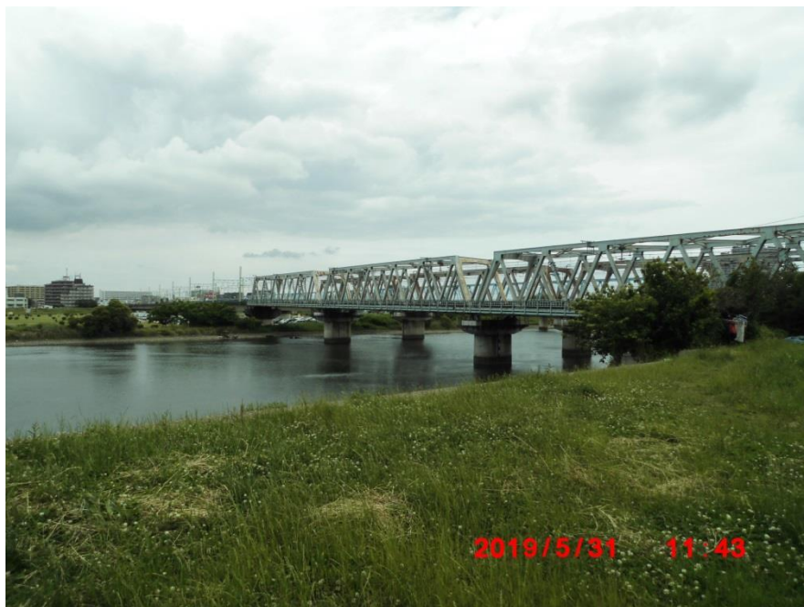
鉄橋。京浜東北線、東海道線、京急本線の3つの橋が架かっています。