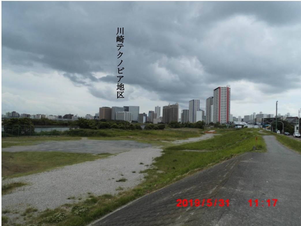
多摩川が大きく右に蛇行して流れています。