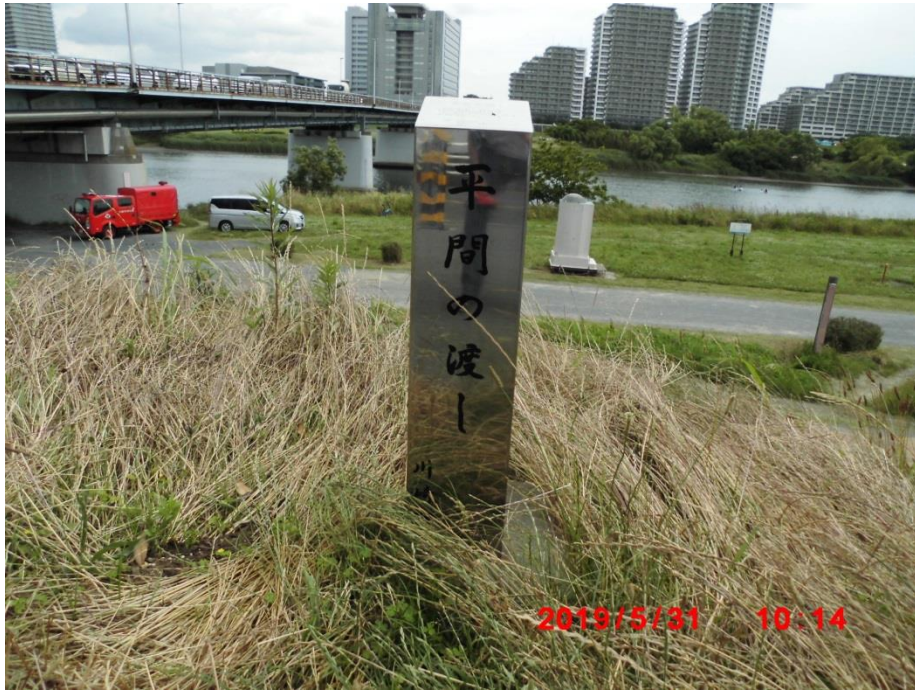
平間の渡し。ここでも対岸の東京側は高層建物が多い。