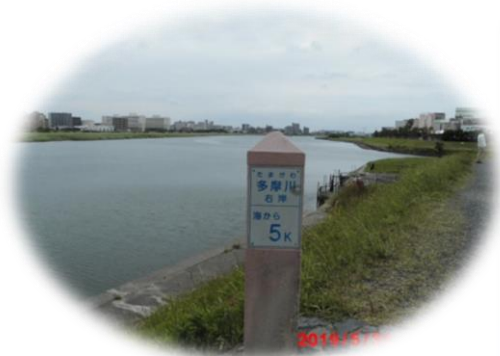
河港水門付近から河口まであと5キロ。