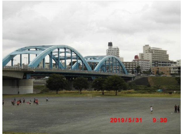
丸子橋。鋼トラス式タイドアーチ橋橋長 397m