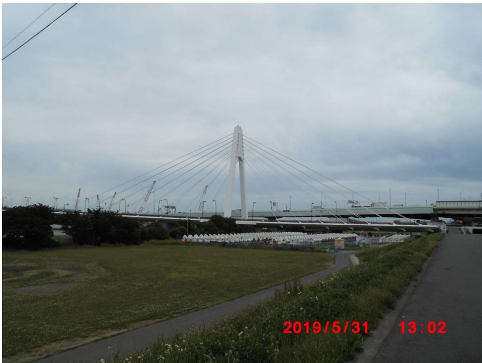
斜張橋 全長 550m。2007 年上り線下り線完成