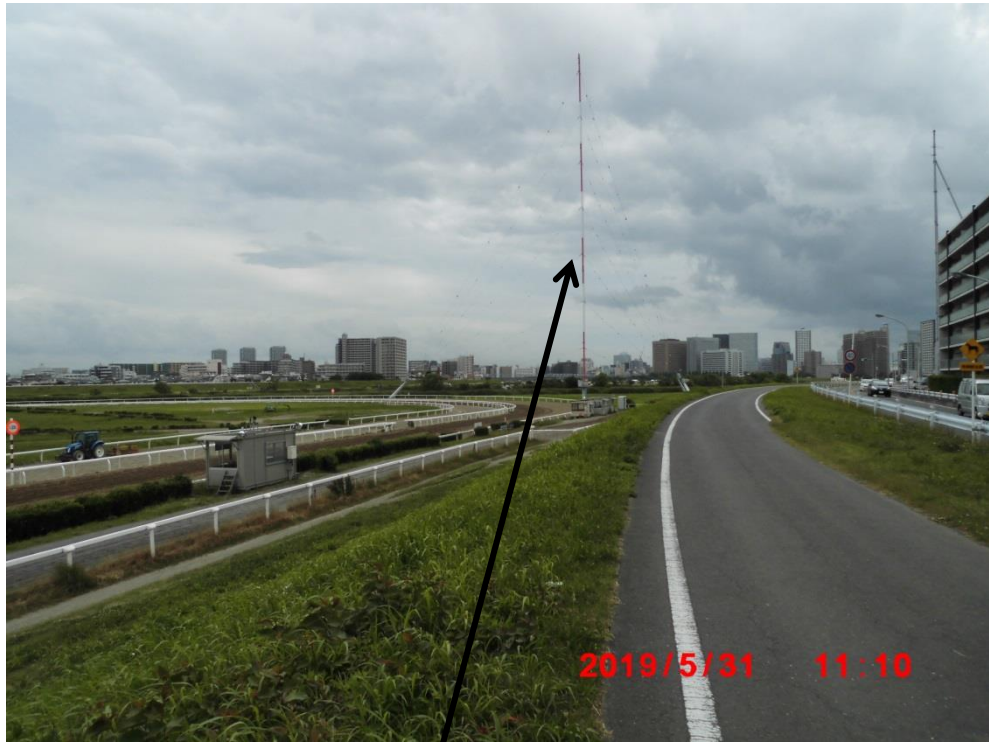
アール・エフ・ラジオ日本のアンテナ。左手は競馬の練習場。