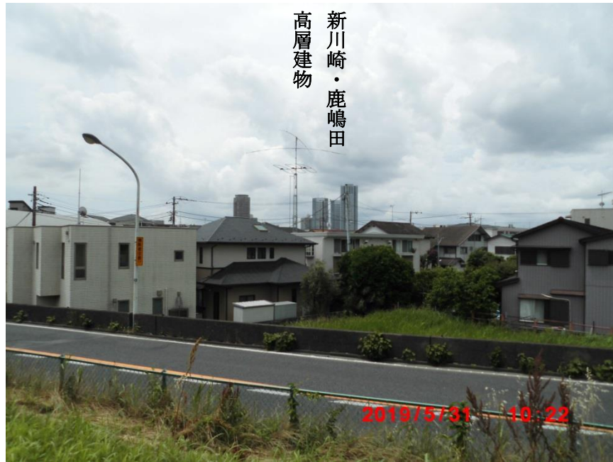
新川崎・鹿嶋田方面を望む