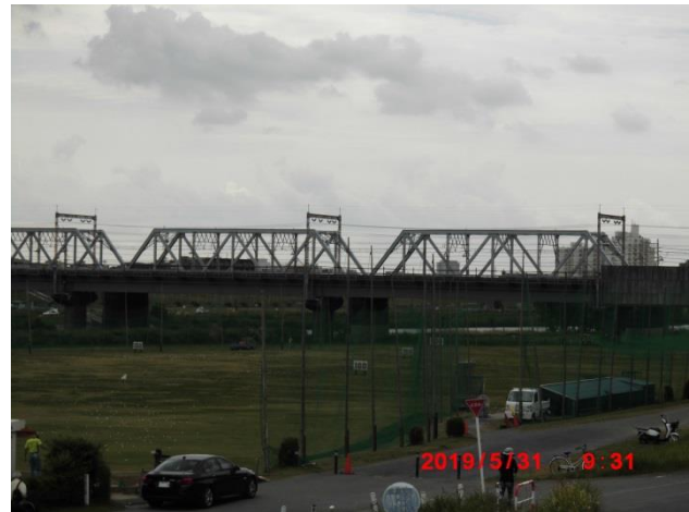
東海道新幹線及び横須賀線の橋梁