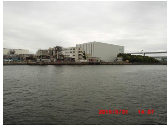
やっと浮島の地先につきました。花王工場と東京湾を望む