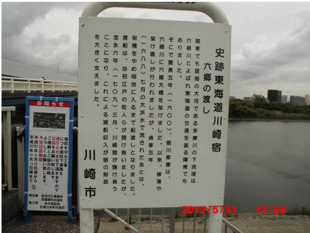
六郷の渡しの案内版