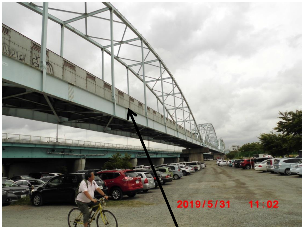
国道に併設された共同溝