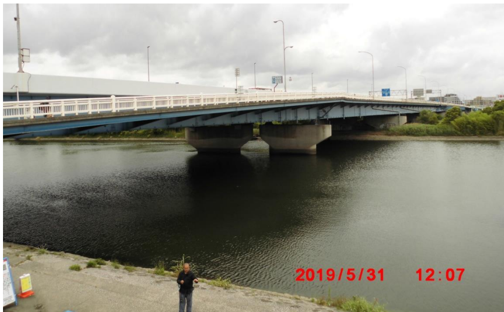
六郷橋。第一京浜。国道 15 号線。全長 443.7m