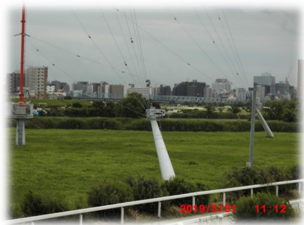
アンテナのアンカー