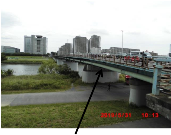
桁下にガス導管が見える。