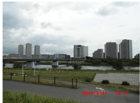
下流側からガス橋を望む。東京側は高層建物が多いのがよくわかる。