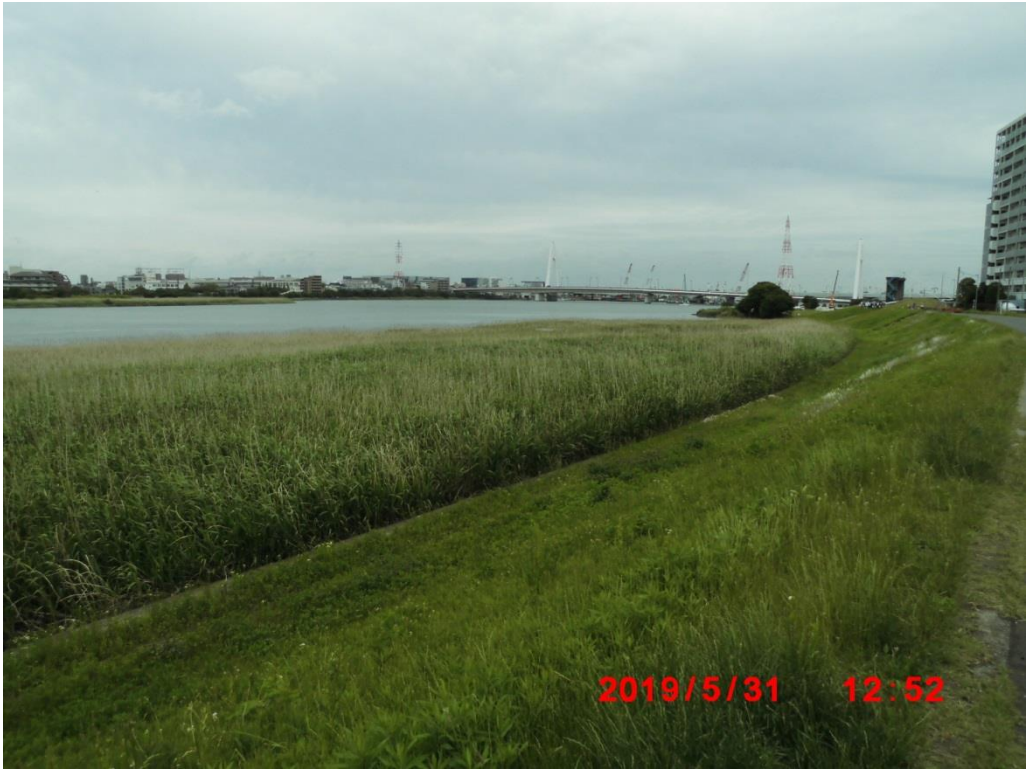
大師橋が見えてきた。