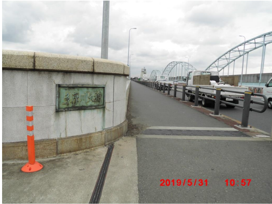
多摩川大橋 国道1号線の橋。右手のアーチ橋は東電とNTTの共同溝の橋