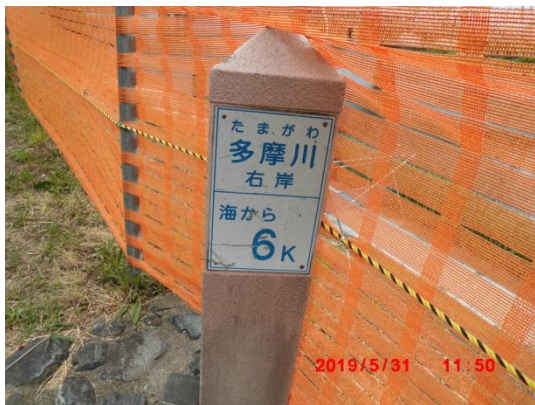
六郷ポンプ場から河口まであと6キロ。