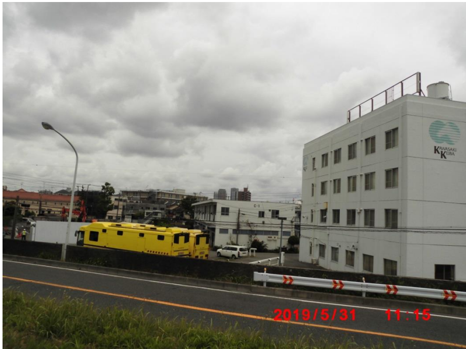
小向厩舎。黄色い車は馬を運ぶための車か。