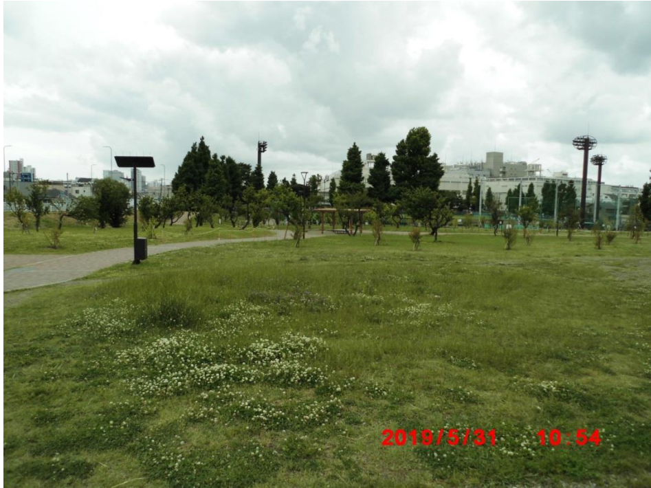
御幸公園。この一帯は過っては梅林があったそうです。