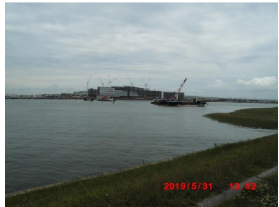
羽田連絡道路建設中