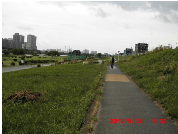
河口に向かって歩く。東京側は高層マンション群が多い。