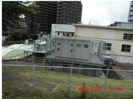
六郷ポンプ場。老朽化に伴い再整備の計画中。