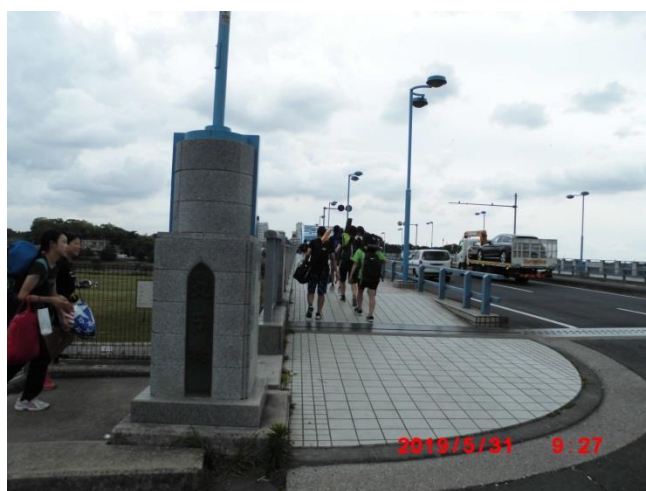
丸子橋から河口に向けてスタート。