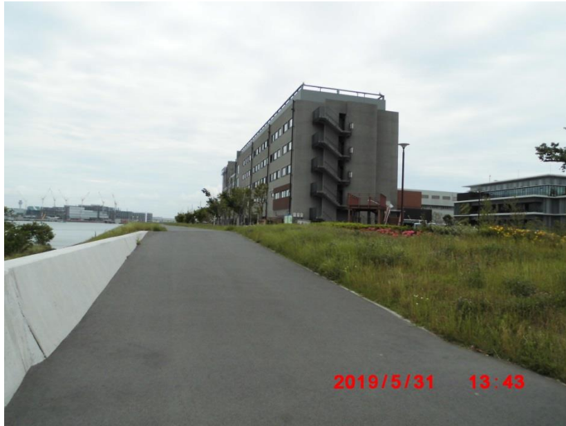
キングスカイフロントエリアの東急 REI ホテル