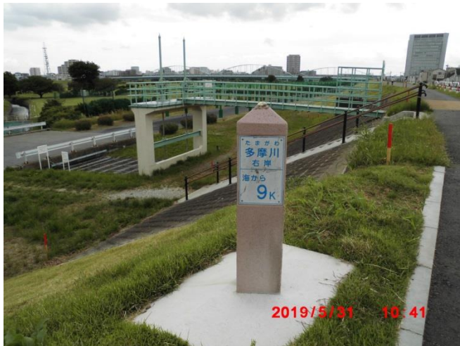
下流側の多摩川大橋方面を望む