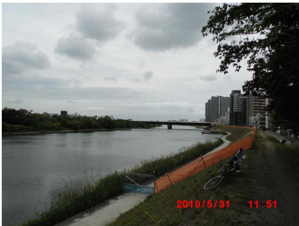
六郷ポンプ場の堤防から河口方面を望む。あと河口まで6キロ。