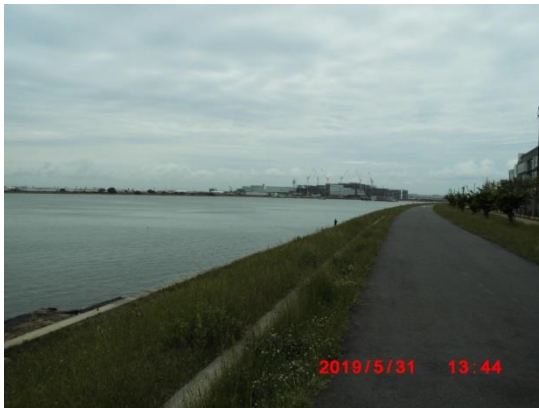
羽田国際空港を望む