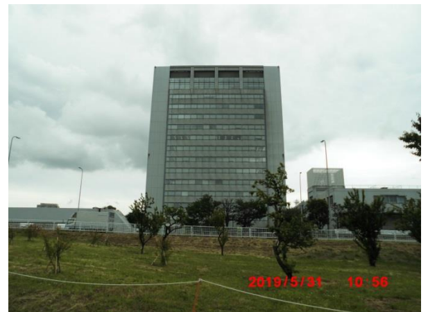
川崎総合科学高校