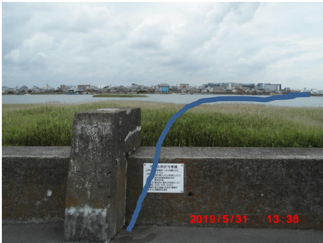
東海道貨物線羽田トンネル